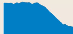
Blaue Strecke (11 km)

Trott'energy, Helm (mit Hygieneset), Karte, Pannenkitt.