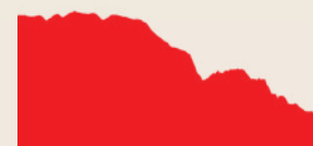
Rote Strecke (15,6 km)

Steigung: 130 m Abfahrt: 484 m Dauer: 1h45' (± 15')