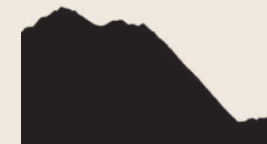
Schwarze Strecke (12,1 km)

Steigung: 218 m Abfahrt: 572 m Dauer: 2h15' (± 15')